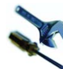
TAKUU / HUOLLON LAINALAITTE