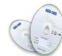
OHJELMISTOPÄIVITYKSET KOLME KERTAA / VUOSI