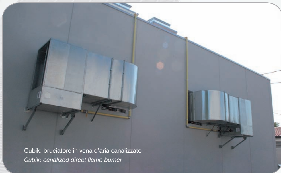
Cubik: bruciatore in vena d'aria canalizzato Cubik: canalized direct flame burner

by different heights and types: from the prepainted metal column (white RAL 9003) to the system with reticular beam to avoid the columns, which would be positioned between one plenum and the other.