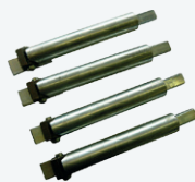
Set di 4 estensioni 42"-56" Set of 4 extensions 42"-56"