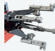
Adattatore per ruote EM e OTR EM and OTR wheels adapter