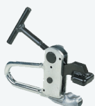
Morsetto per cerchi Alu Alloy rims clamp