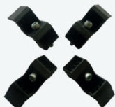
Set protezioni cerchi Alu Set of 4 jaws for alloy rims