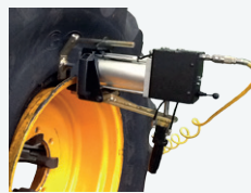
Premi tallone pneumatico Pneumatic bead pressing device